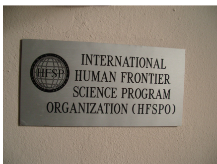
ストラスブールの事務局

注) 運営支援国は、2010年1月現在、オーストラリア、オーストリア、ベルギー、カナダ、キプロス（EUに加盟している地域に限る）、チェコ、デンマーク、エストニア、フィンランド、フランス、ドイツ、ギリシャ、ハンガリー、インド、アイルランド、イタリア、日本、韓国、ラトビア、リトアニア、ルクセンブルク、マルタ、オランダ、ニュージーランド、ノルウェー、ポーランド、ポルトガル、スロバキア、スロベニア、スペイン、スウェーデン、スイス、英国、米国