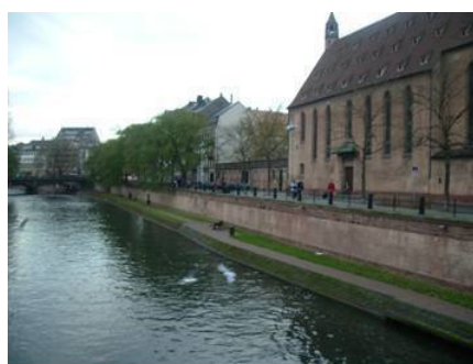
ストラスブールの事務局周辺の様子